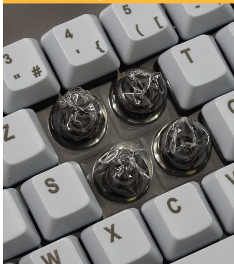
Technologie course longue