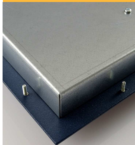
Une technologie d'exception