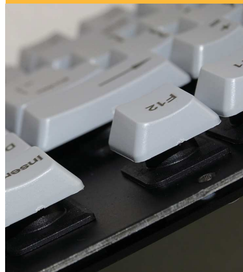
Une technologie d'exception