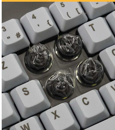
Technologie course longue